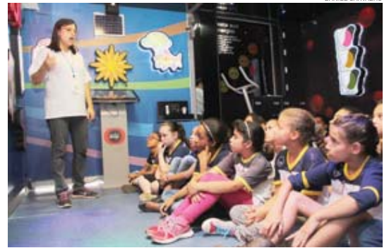
Alunos de Mogi já iniciaram a visita ao caminhão da EDP

A EDP Bandeirante, distribuidora de energia elétrica que atende o Alto Tietê, percorrerá 20 escolas públicas de Mogi com o Caminhão da Boa Energia. O laboratório itinerante permite que estudantes e professores recebam informações sobre o uso seguro e eficiente da energia. Cidades, página 4