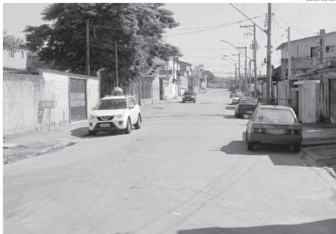
Bailes funk na rua Francisco Rodrigues têm causado transtornos à comunidade

“A Prefeitura diz que só vai se tiver um ou dois carros no máximo, se o som for em residência ou bar, caso contrário, temos que contatar a Polícia Militar. Quando ligamos para eles, somos informados que vão enviar viaturas, porém, sempre tem