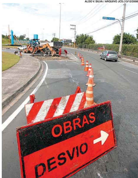
O valor recebido é investido em recapeamento de vias

■ No ano passado, o Estado notificou proprietários de 4,8 mil veículos de Sorocaba, com débitos que somavam R$ 4 milhões