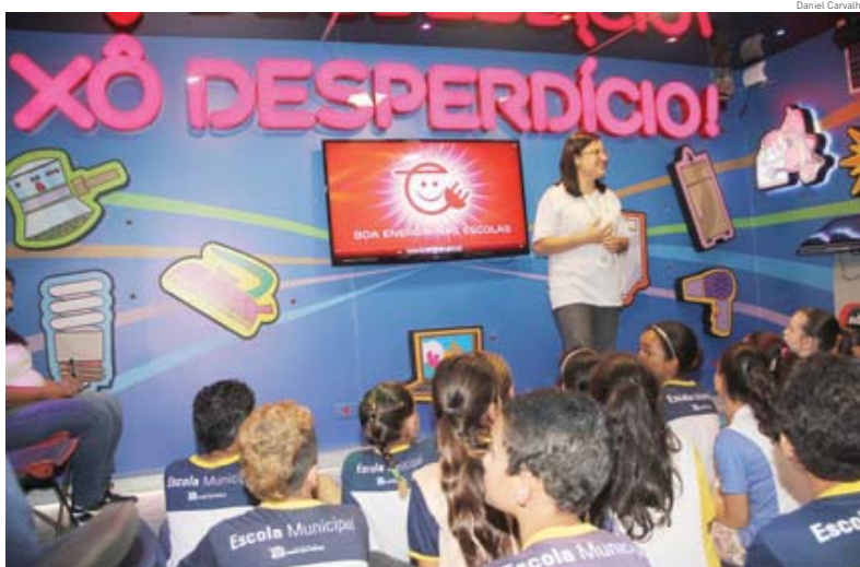
Alunos de escolas públicas de Mogi participam até sexta de atividades no Caminhão da Boa Energia

O Dia Mundial da Energia, celebrado amanhã, lembra a importância do uso consciente da eletricidade. Pensando nisso, a EDP Bandeirante percorrerá, até sexta-feira, 20 escolas públicas de Mogi das Cruzes, com o Caminhão da Boa Energia. Cidades, página 9