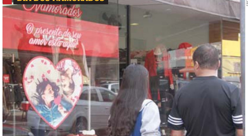
Comércio de Suzano já se prepara para a data. Cidades, página 6