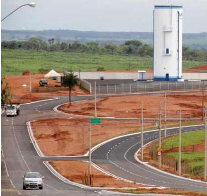
ECO PARQUE - Primeira etapa inaugurada em dezembro do ano passado