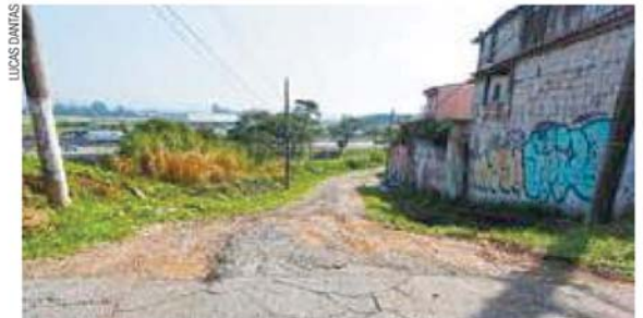
Sem asfalto - Via tem uma descida íngreme e está cheia de buracos

Em uma das vezes em que o morador reclamou, o Fácil informou que sua rua era asfaltada