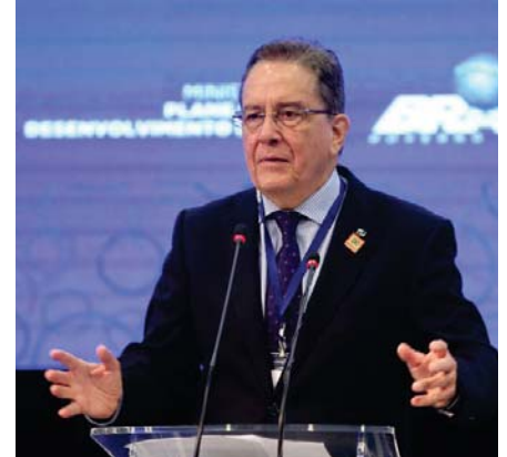
PAULO RABELLO - Novo presidente do BNDES