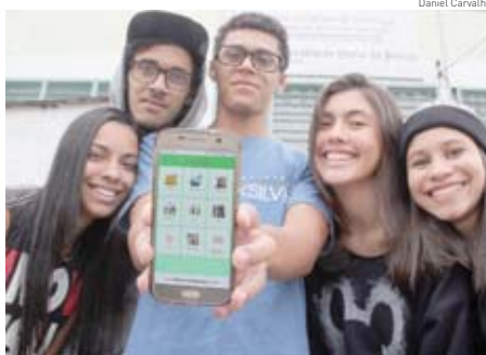
Estudantes foram premiados com plataforma digital

Agora, os mogianos participaram da Mostra Brasileira de Ciência e Tecnologia