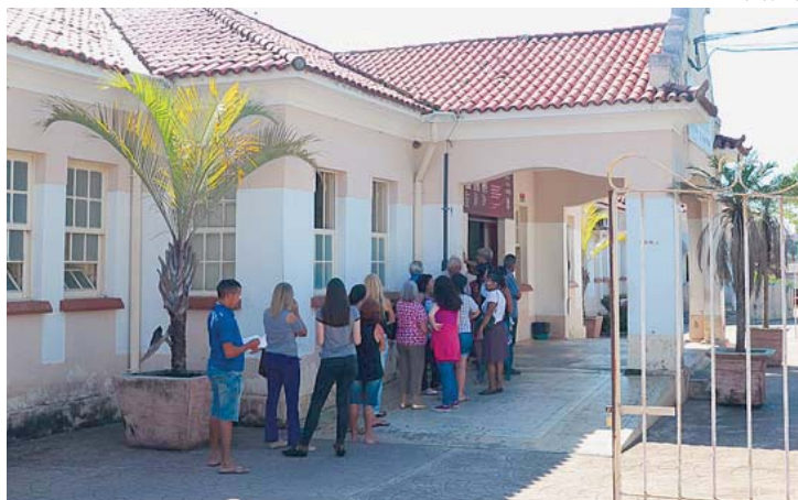
Policlínica Municipal de Especialidades é um dos quatro locais que oferecem os exames

A espera por um exame de ultrassonografia na rede municipal de saúde pode chegar a até três anos na cidade. Segundo levantamento feito pela Secretaria da Saúde de Sorocaba para o Cruzeiro do Sul , atualmente a fila de espera por exames de ultrassom soma 20.577, e as guias mais antigas são de 2014. Ainda de acordo com os dados divulgados pela pasta, dentre todos os tipos