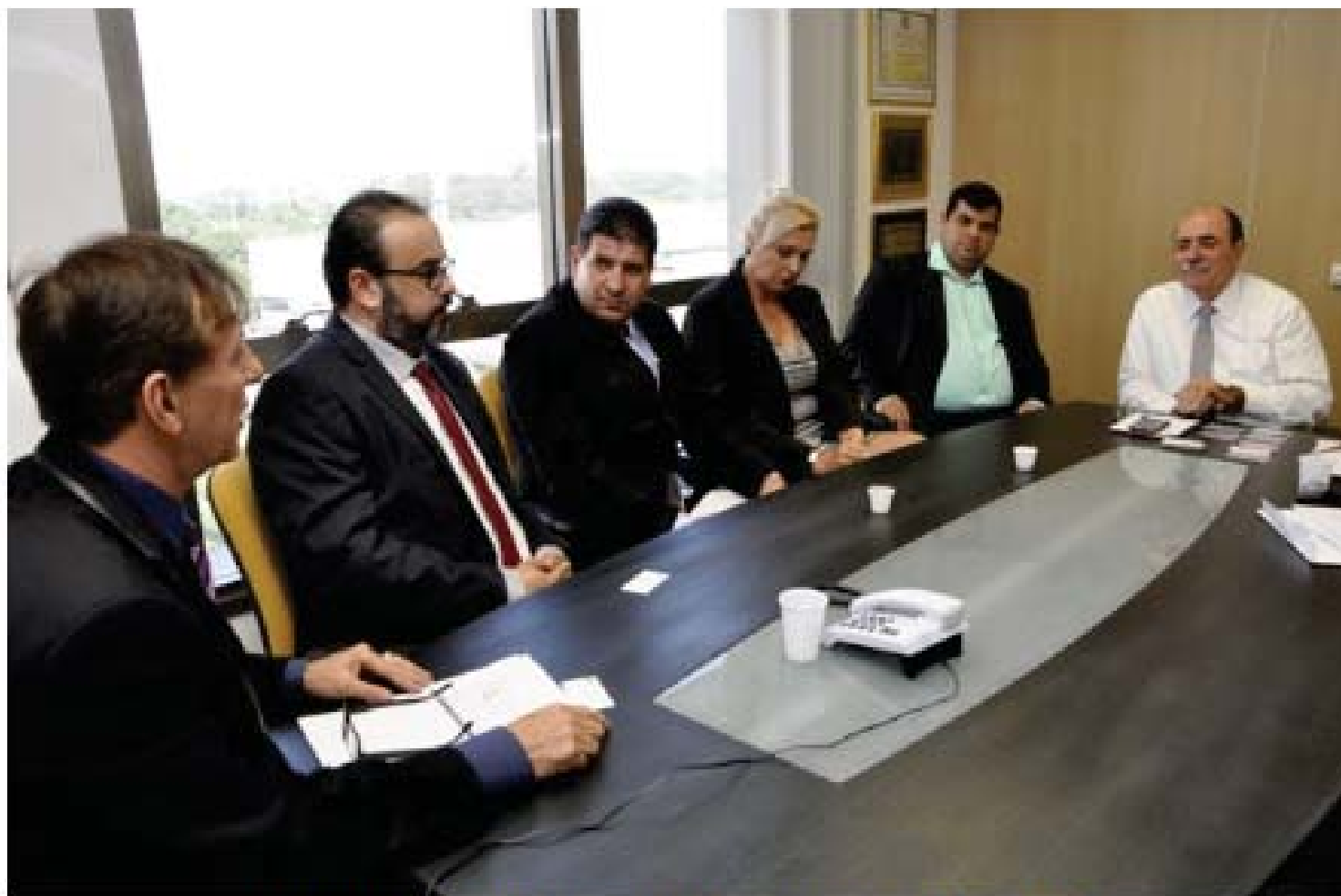
Vereadores durante encontro com o deputado João Caraméz

Comitiva da Câmara Municipal esteve, na terça-feira, na Assembleia Legislativa de São Paulo para reforçar a luta pela inclusão de Limeira no projeto do Trem Regional Paulista. Já existe um abaixo-assinado com cerca de 10 mil adesões sobre o tema.