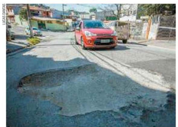
Trânsito - Avenida tem movimento intenso de ônibus e carros de passeio

"É muito ruim essa situação", disse a dona de casa