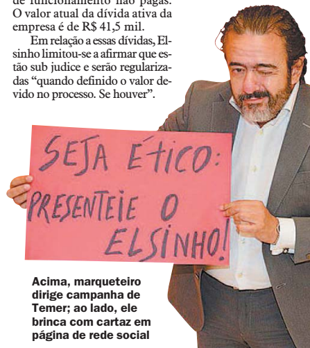
Acima, marqueteiro dirige campanha de Temer; ao lado, ele brinca com cartaz em página de rede social