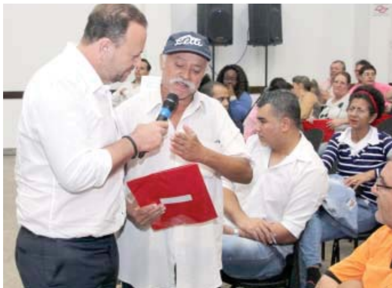
Segundo o prefeito Edinho Silva, os representantes do Orçamento Participativo são “lideranças junto à comunidade”

São eles: Conselho Municipal de Desenvolvimento Econômico e Social (cinco representantes do OP), o Conselho Municipal de Tu-