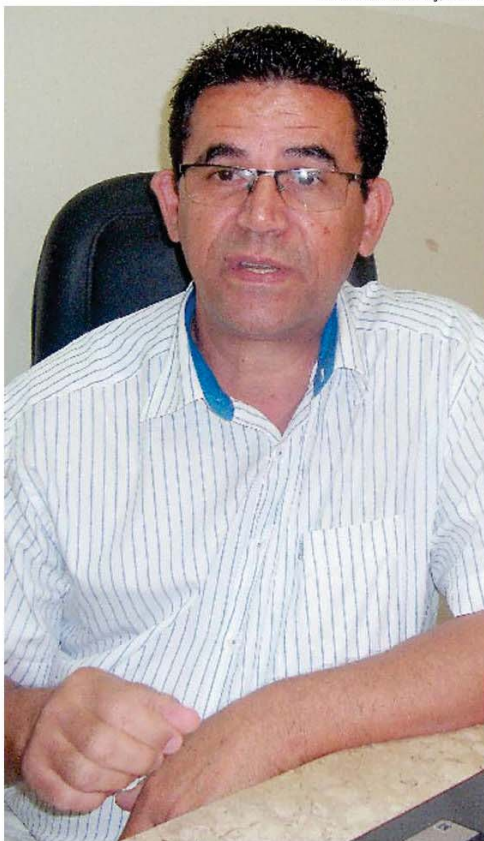
Ronaldo Ruiz Galindo/Folha da Região - 24/05/2017

COMPARAÇÃO Iniciativa privada e gestão pública são semelhantes, diz Izídio