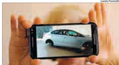
Morador do Taquaral mostra foto feita com celular do veículo erguido após furto

Um quadrilha silenciosa tem deixado os moradores da região do Taquaral, em Campinas, apreensivos. Os criminosos invadem as casas, furtam as quatro rodas dos carros, quebram vidros, tiram estepes e objetos de valor e depois ainda deixam os veículos sobre macacos hidráulicos. Em 40 dias foram registrados cinco casos semelhantes. PÁGINA A8