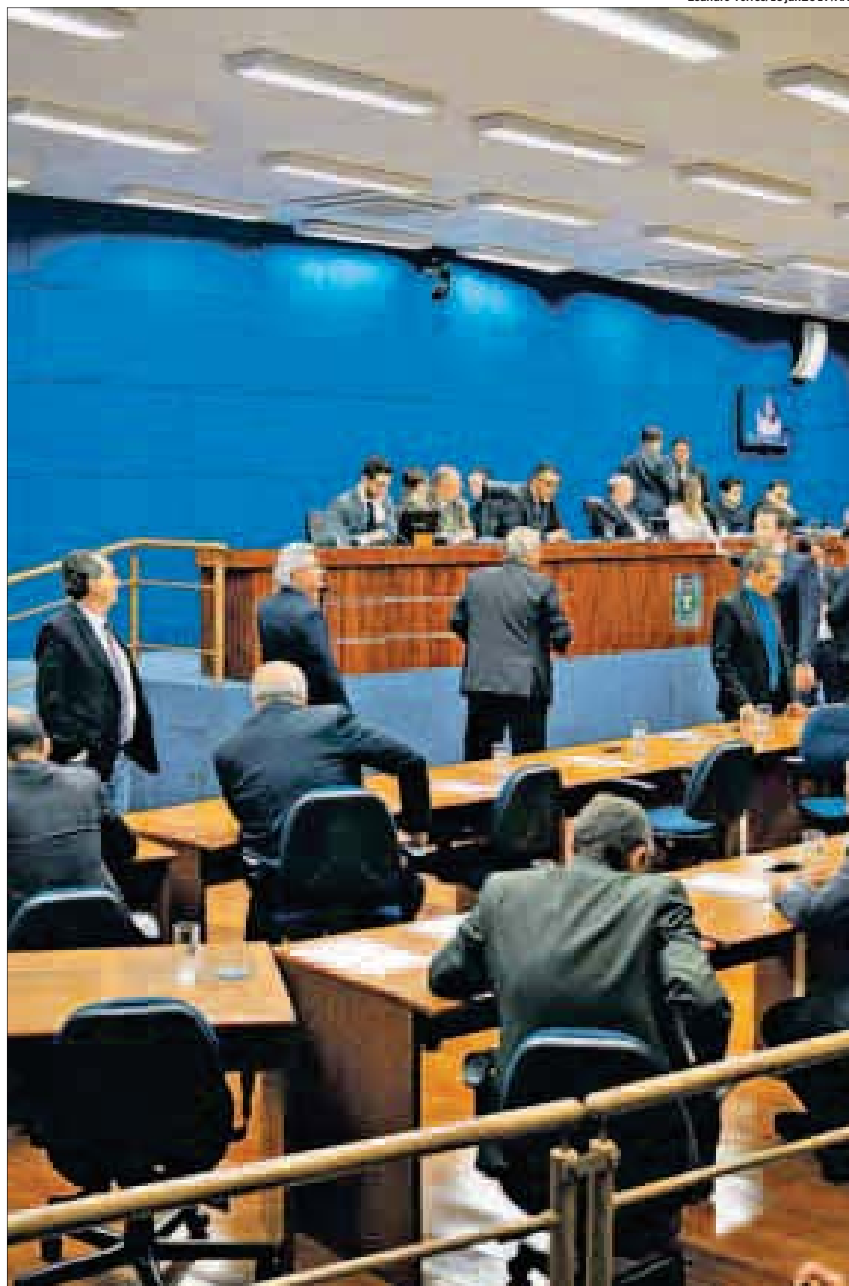
Vereadores durante sessão da Câmara: número de assessores nos gabinetes cai de 10 para 4 após sentença

Assim que nomeados todos os servidores, o número chegará a 132 permitidos. A lista pode ser conferida no site da Prefeitura, através do link Diário Oficial ( http://www.campinas.sp.gov.br/urploads/pdf/669635787.pdf ).