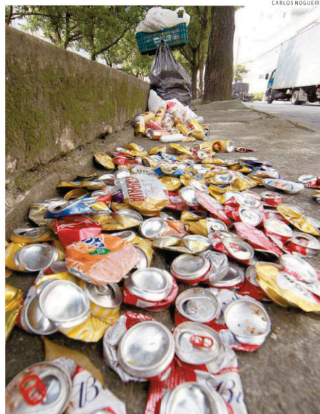
Outra meta da lei é livrar os aterros de itens renováveis como as latas

Ação é promessa para reduzir o montante gasto pela Prefeitura à destinação de lixo produzido da Cidade. E ainda proteger o meio ambiente e incentivar a geração de renda aos