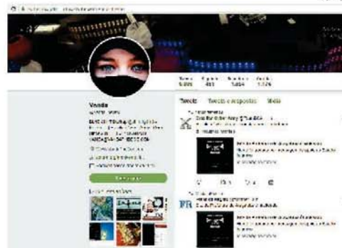
'RECADO' Mensagem no portal diz que presidente americano será responsabilizado pela morte de muçulmanos; acima, o hacker compartilhou matéria da Folha no Twitter

Araçatuba José Marcos Taveira politica@folhadaregiao.com.br