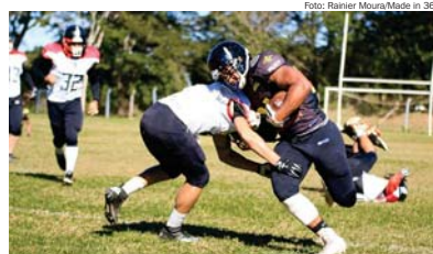
Rio Preto Weilers atropelou o Botafogo por 33 a 0