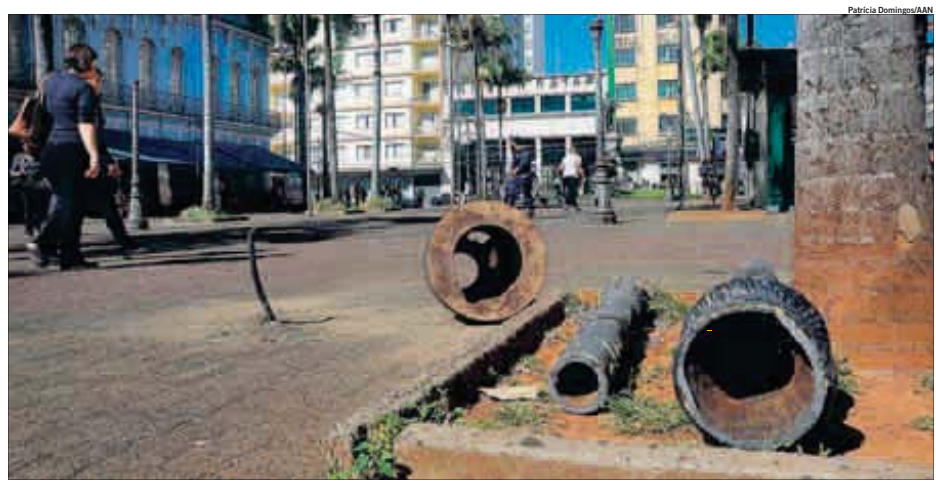
Poste danificado por atos de vandalismo na madrugada de sábado, na Praça Bento Quirino, área histórica da região central de Campinas: prejuízo ao patrimônio