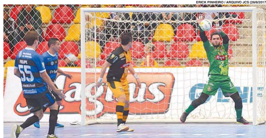
Time vem de vitória sobre o Tubarão pela Liga Nacional. Jogo será na Arena Sorocaba

O editorial Descaso com as vacinas comenta a queda na cobertura das últimas campanhas de vacinação, fonte de preocupação para o Ministério da Saúde. Parte dessa ausência aos postos de vacinação se deve ao desinteresse, mas cresce o número de pessoas que se negam a vacinar seus filhos. Pág. A3