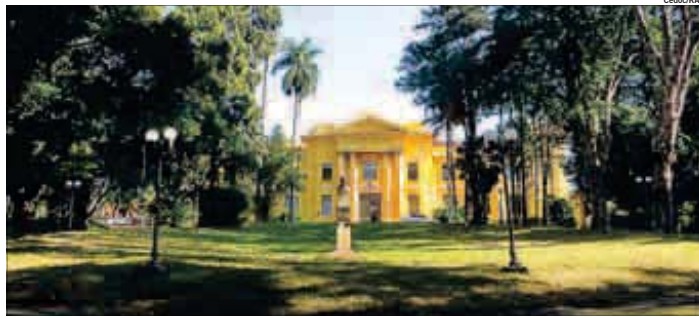
Prédio do Instituto Agrônomo de Campinas (IAC), que comemora hoje seu aniversário de 130 anos de fundação com evento

Ex-ministro de Lula e Dilma recebeu sentença de Moro em primeira instância por lavagem de dinheiro e recebimento de propina na Petrobras. PÁGINA A13