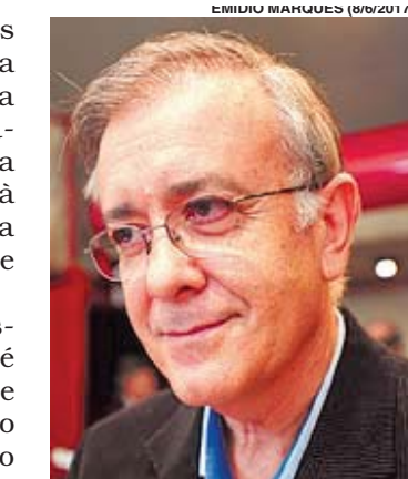
Crespo não fala sobre declarações

Em letras maiúsculas, ela acrescentou: “Não retiro absolutamente nada do que foi por mim dito em