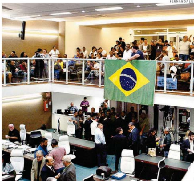
Cerca de 150 funcionários da empresa foram à Câmara protestar