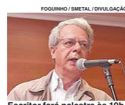
Escritor fará palestra às 19h