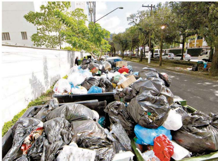
O residencial Acquaplay, no Marapé, produz três toneladas diárias de lixo e já contratou uma cooperativa