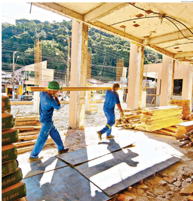
A unidade passa por obras para se adequar às transformações previstas. O novo Pronto Atendimento deve ser entregue em novembro