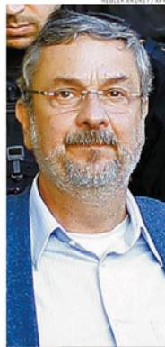
Ex-ministro Antônio Palocci