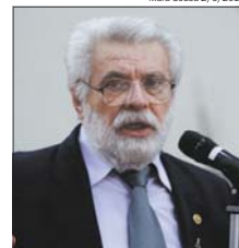
Mara Sousa 2/6/2017

O presidente do Tribunal Superior Eleitoral (TSE), ministro Gilmar Mendes, disse nesta segunda-feira, 26, que aqueles que defendem uma "República de promotores e juizes" ficariam decepcionados com o resultado. "Considerando os paradigmas que adotamos (o Judiciário), em geral muito concessivo para servidores, se administrássemos o deserto do Saara, faltaria areia em pouco tempo. Portanto, moderação com esse tipo de pretensão", afirmou.