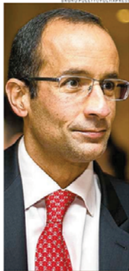
Empresário Marcelo Odebrecht