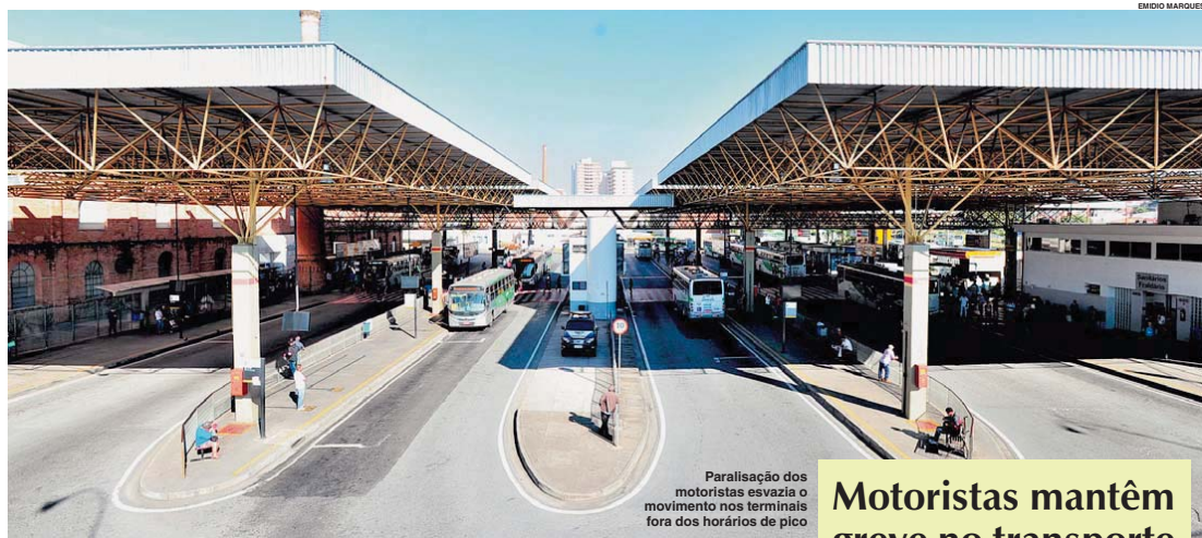
Paralisação dos motoristas esvazia o movimento nos terminais fora dos horários de pico