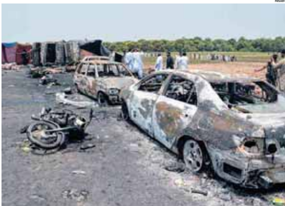
Mais de cem veículos na estrada foram atingidos pelo fogo após explosão de caminhão-tanque

empresa de São Paulo, contratada em fevereiro deste ano. Com base nessa diretriz é que, no segundo semestre, o Estado deverá iniciar o processo de licitação para, enfim, definir responsável pelas obras. ● PÁG. 7