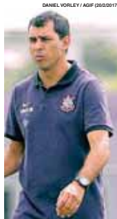
Carille quer vitória

O Corinthians faz hoje uma "decisão" contra o Grêmio, em Porto Alegre. É o confronto do primeiro e segundo colocados na classificação do Brasileiro. Já o São Paulo enfrenta o Fluminense e o Palmeiras, a Ponte Preta. Ontem, o Santos perdeu por 1 a 0 para o Sport. Págs. A11 e A12