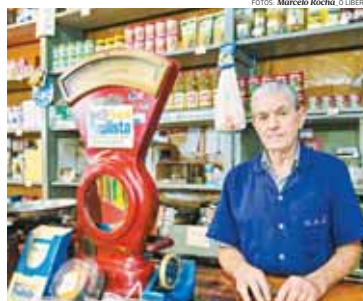
ABANDONO. Mantido pela prefeitura com aluguel de permissionários, local tem bolor, goteira e fiação exposta; comerciantes agora bancam até zelador para funcionarem aos fins de semana