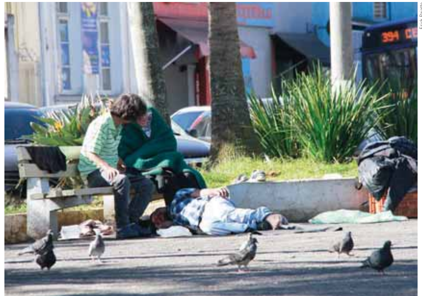
Só em Mogi, a população em situação de rua é calculada atualmente em mais de 200 pessoas

Estimativa de sete Prefeituras mostra um cenário preocupante e a necessidade de políticas públicas realmente eficazes. Cidades, página 7