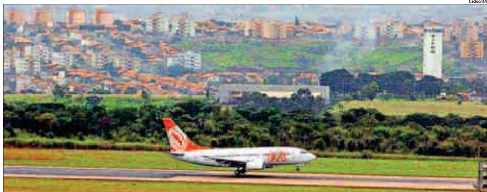
Aeromane em operação de pouso no Aeroporto Internacional de Viracopos, em Campinas, que tem planejamento para se tornar o maior em área de toda a América Latina