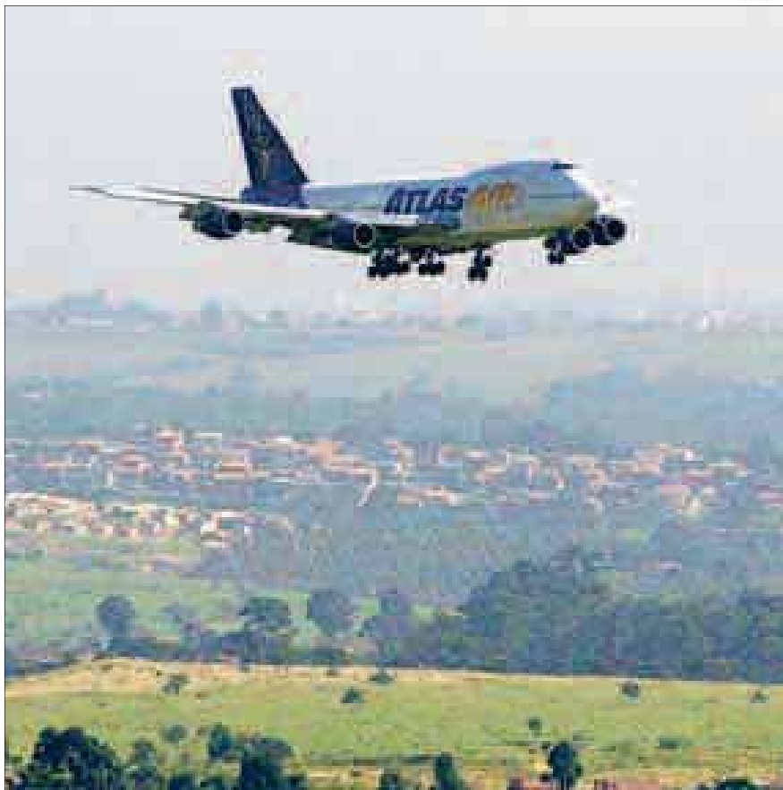
Avião cargueiro durante operação para o pouso no Aeroporto Internacional de Viracopos, em Campinas

A crise econômica que levou a queda no número de passageiros desacelerou os planos de expansão do aeroporto, cujo crescimento físico está baseado, por contrato de concessão, em gatilhos de volume de passageiros. A construção da segunda pista,