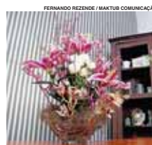
FERNANDO REZENDE / MAKTUB COMUNICAÇÃO

Festa de Votorantim termina hoje com show e fogos Pág. C1