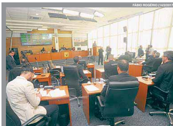
FÁBIO ROGÉRIO (14/2/2017)

A aprovação do governo de Michel Temer (PMDB) caiu para 7%, segundo pesquisa divulgada ontem pelo instituto Datafolha. O índice é o mais baixo para um governo desde setembro de 1989, quando o então presidente José Sarney obteve 5% de aprovação, durante o período da hiperinflação. Segundo os números da pesquisa, 7% consideram o governo ótimo ou bom, enquanto 69% disseram que era ruim ou péssimo e outros 23% avaliaram como regular. O Datafolha ouviu 2.771 pessoas entre as últimas quarta e sexta-feira.