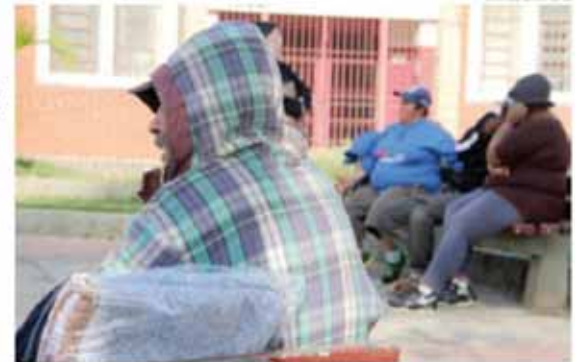
A cada dia se observa mais gente vivendo nas praças das cidades

Sete municípios do Alto Tietê contabilizam pouco mais de 1,8 mil moradores em situação de rua. Os dados são das Prefeituras e representam apenas uma estimativa. Isso porque o deslocamento dessas pessoas de um local para outro impossibilita a obtenção de um indicador concreto. Cidades, página 6