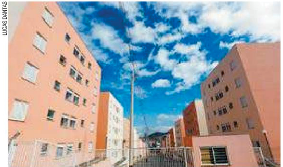
Habitação - Segundo os proprietários, apartamentos já estariam prontos

380 famílias esperam para mudar no Bananal